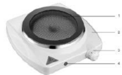
975827 - VHP 1Z K 121C