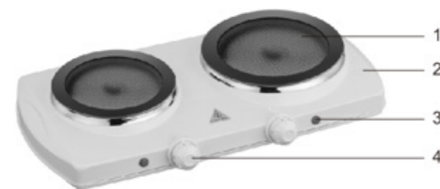
975828 - VHP 2Z K 121C